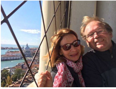
Objekt ID: 70915